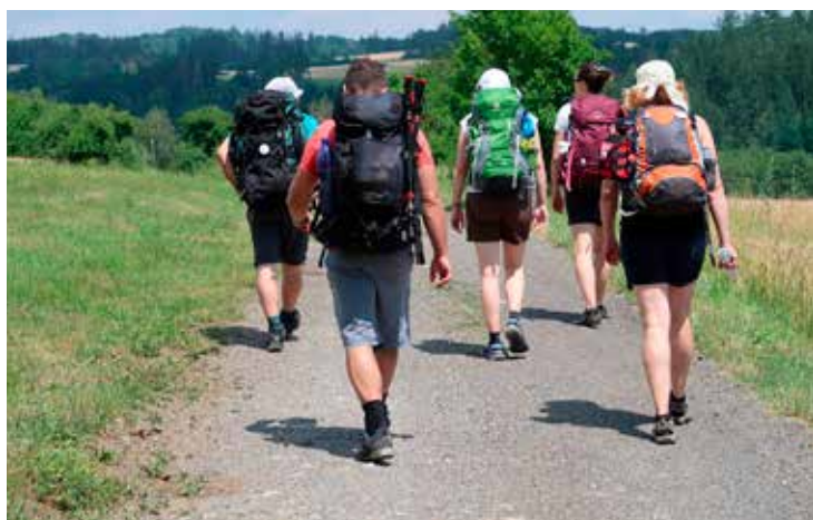
Nová poutní stezka měří necelých 190 km

Spolek Cesta Česka otevřel ve spolupráci s Klubem českých turistů novou poutní stezku. Poutní cesta Blaník-Říp propojuje dva bájně vrcholy v České republice a měří necelých 190 km. Putování začíná v Louňovicích pod Blaníkem, pokračuje převážně po vyznačených turistických cestách a končí na hoře Říp pod rotundou sv. Jiří. Závěrečný úsek trasy vede na Říp z obce Ctiněves, tedy z místa, kde se každý rok v květnu koná též Pouť Českého Anděla.